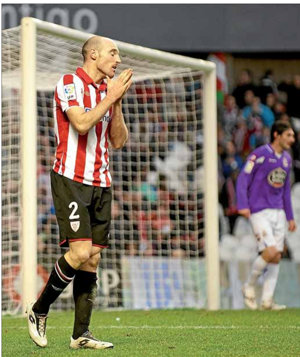
Argazkia: Jon HERNÁEZ | ARGAZKI PRESS

El Athletic no comenzó el año con buen pie y cayó en San Mamés ante el Deportivo (1-2). Su arreón inicial estuvo falto de puntería y el castigo llegó en forma de penalti en contra a los 21 minutos, dando el banderazo de salida a una pésima actuación del árbitro. La expulsión de San José y el segundo tanto gallego (minuto 52) ponían el choque muy cuesta arriba. Aunque el Athletic nunca bajó los brazos, el gol de Llorente no fue suficiente. >30-31