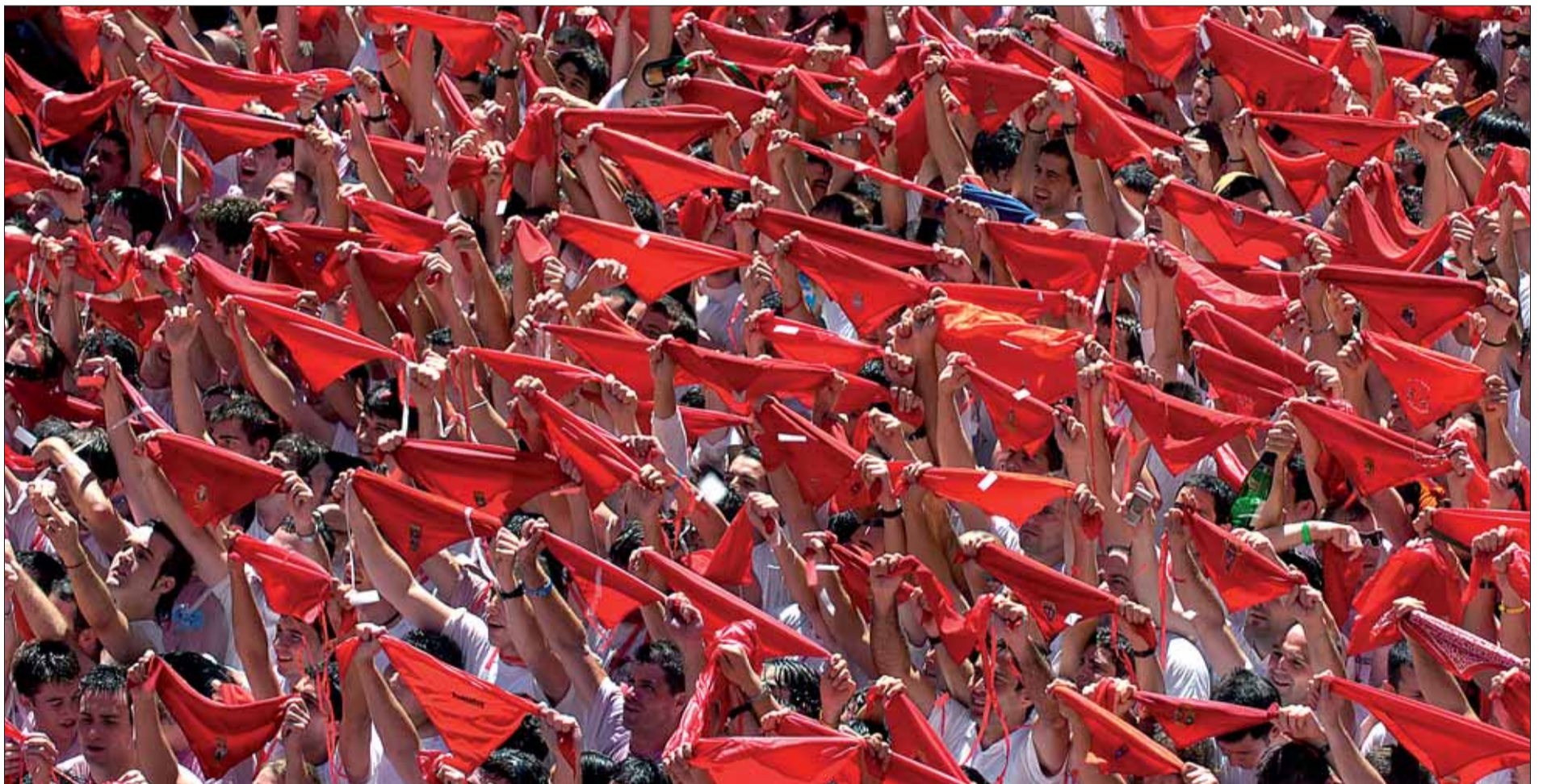
Miles de pañuelos rojos miran al balcón del Ayuntamiento al mediodía de ayer. Faltaban segundos para que la fiesta empezara.