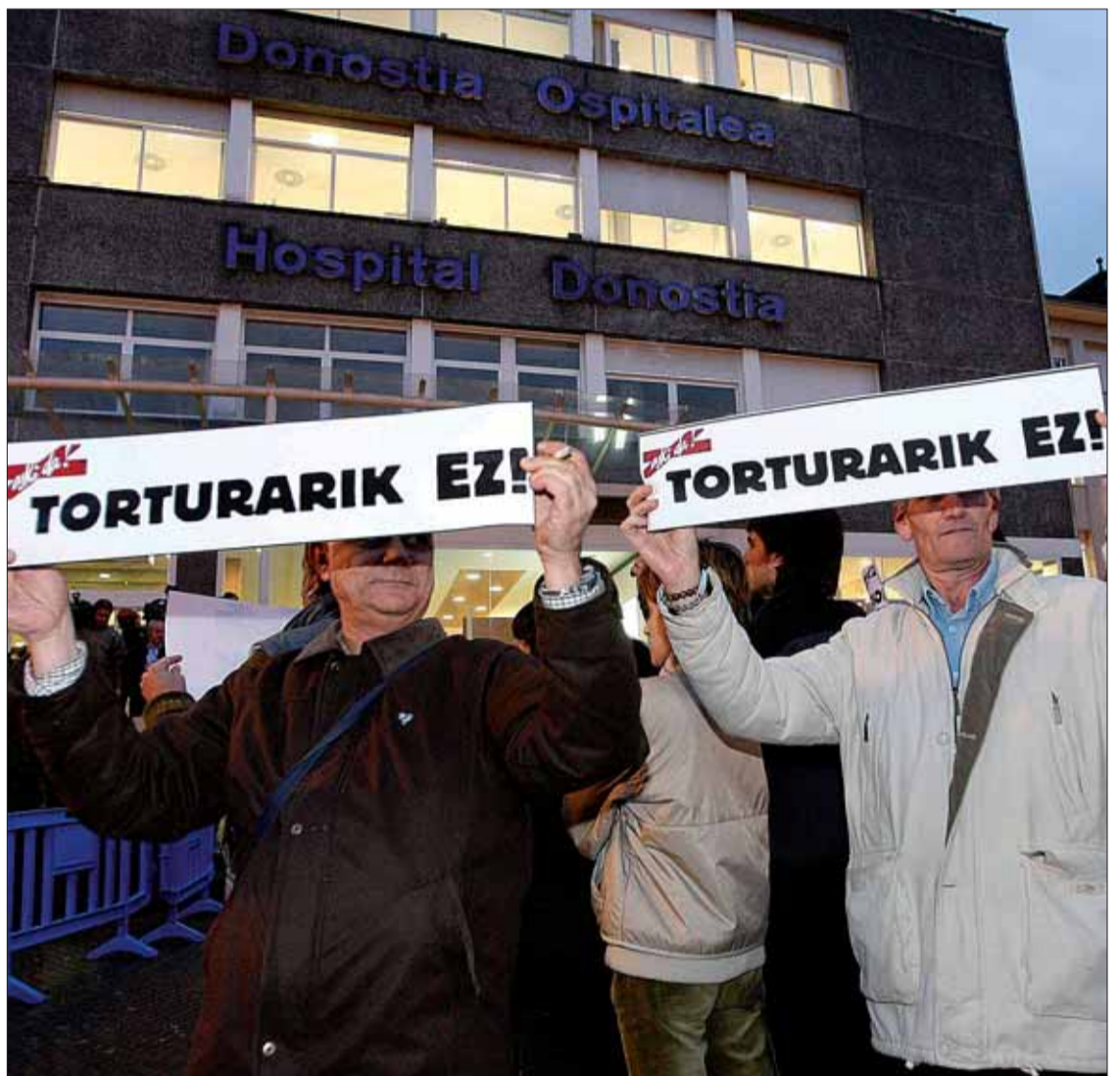
Varios centenares de ciudadanos se concentraron ayer tarde ante el Hospital Donostia.

Recordar a PNV, NaBai (Aralar, EA y PNV) y EB, que muestran ahora su preocupación por estos hechos, que hace poco más de un mes apoyaron a «todas las Fuerzas y Cuerpos de Seguridad y a todos los componentes de la Administración de Justicia en su lucha contra el terrorismo». Un cheque en blanco que ayer hicieron amago de retirar. En este caso llegan tarde. Para el resto, si tienen voluntad, no.