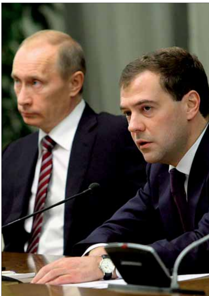
Medvedev (a la derecha) y Putin en una imagen de archivo.

Diez años después, Moscú da por terminada la guerra aunque ha advertido que mantendrá tropas para hacer frente no ya sólo a la debilitada pero viva resistencia local, sino con la vista puesta en la creciente extensión del conflicto a otras repúblicas norcaucásicas como Daguestán e Ingushetia. >2-3