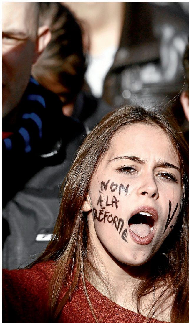
Gazte bat oihuka, Parisko manifestazioan.