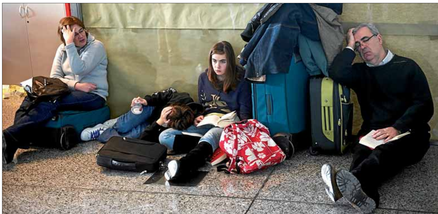
Pasajeros de todas las edades desesperan atrapados ayer en el aeropuerto de Loiu.

Concentraciones en las capitales vascas el próximo viernes 10 de diciembre, Día de los Derechos Humanos, serán la primera acción del movimiento por los derechos civiles y políticos de Euskal Herria que dio su primer paso ayer en Durango, y que hunde sus raíces en la comparecencia del Kafe Antzokia tras el veto a la manifestación del 11 de septiembre. Su manifiesto se dirige tanto a los estados como a ETA. >8-9