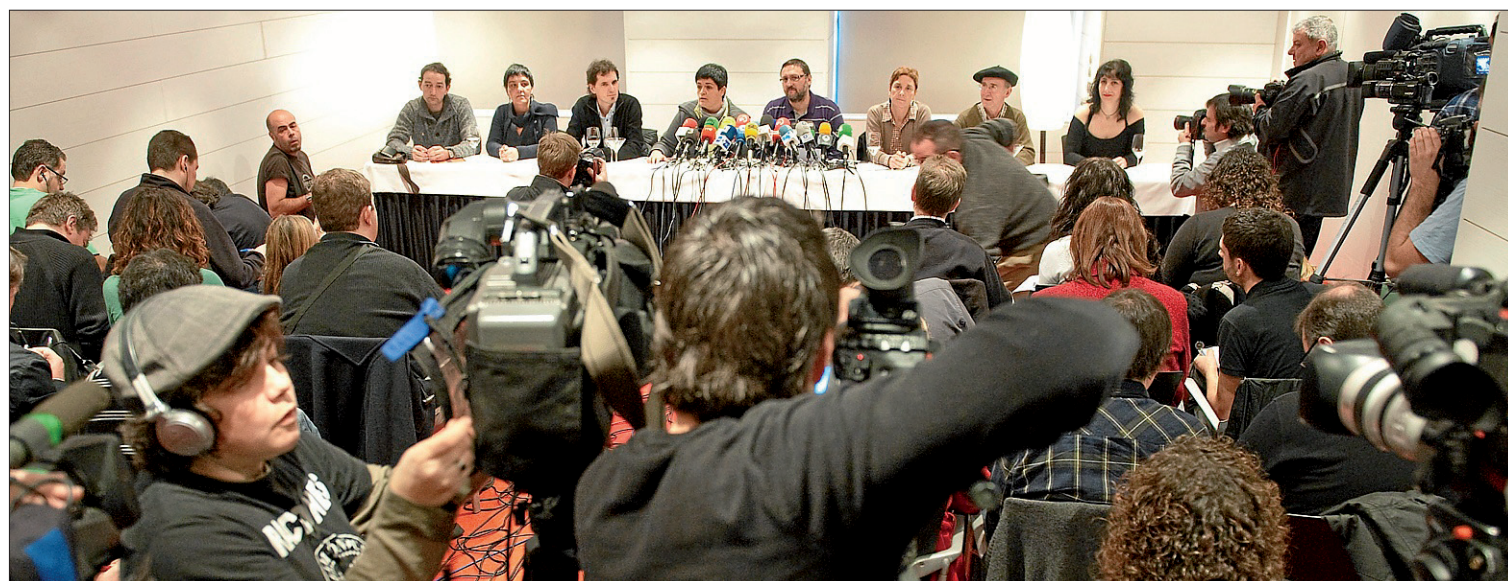
Expectación ayer en Bilbo ante la comparecencia de representantes de la izquierda abertzale.

molestos por el afán del PSOE de presentarle como un aliado incondicional tras la última visita de Urkullu a Moncloa. >2-5