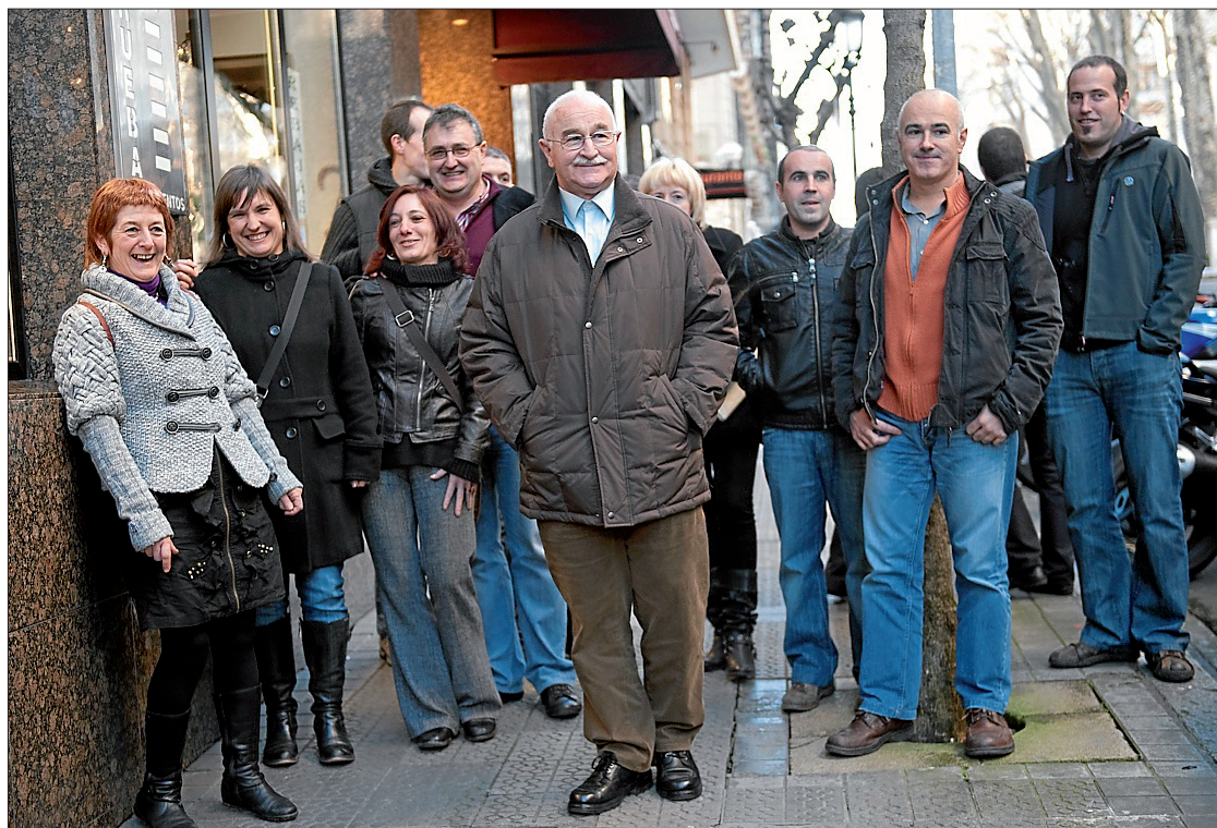
Los miembros de Udalbiltza exculpados, ayer en Bilbo antes de comparecer ante los medios.

La decisión fue recibida con satisfacción muy contenida por los imputados, que recordaron que las redadas policiales siguen y reclamaron que se abandone de una vez por todas la persecución política. Pero la alegría fue patente en las valoraciones de organizaciones políticas y sindicales vascas, la mayoría de las cuales aludieron al nuevo escenario existente. PSOE y PNV no hicieron valoraciones, y el PP aceptó la sentencia. >2-5