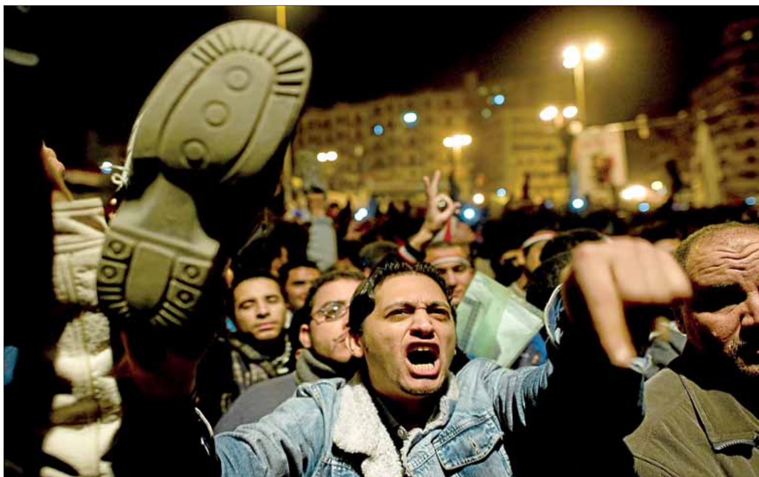
La indignación se apoderó de la plaza Tahrir tras el discurso de Mubarak. Muchos de los manifestantes alzaron sus zapatos a modo de protesta.

Urtero, otsailaren 13-aren inguruan, torturaren aurka Euskal Herrian egiten diren protestekin batera iritsi da albistea. >12